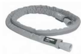
38766 Slangvärmare Standardslang