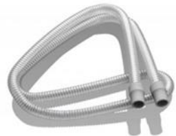
38735 Luftslang CPAP autoklaverbar 2m, 22mm