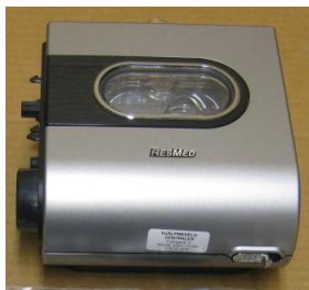
38773 Befuktare H5i