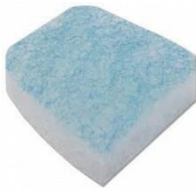
38737 Filter 2 st/fp