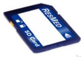
38728 SD-kort S9