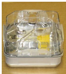
38777 Vattenbehållare Till befuktare H5i