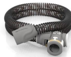
38754 ClimateLine slang