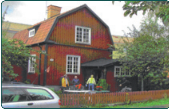
Villa Omtanken Telefon 021-14 02 82 Adress Hökvägen 10

Villa Omtanken är en en träffpunkt som drivs av intresseföreningen med samma namn. Hit kan du komma utan att ta kontakt innan, men det går också bra att ringa först.