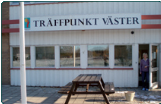
Träffpunkt Väster Telefon 021-39 22 35 Adress Fallhammargatan 3A

Villa Omtanken är en en träffpunkt som drivs av intresseföreningen med samma namn. Hit kan du komma utan att ta kontakt innan, men det går också bra att ringa först.